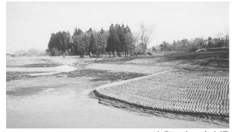
十和田市一本木沢